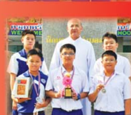
บาสเกตบอล S.D. CUP 58