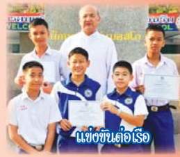
แข่งขันต่อเรือ