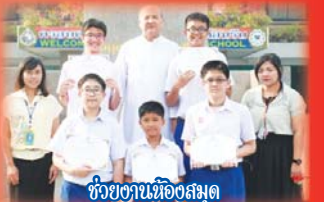
ช่วยงานห้องสมุด