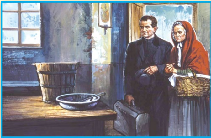
สองแม่ลูกเมื่อเดินทางมาถึงวัลด็อกโก