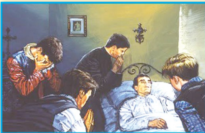
คุณพ่อบอสโกป่วยหนัก