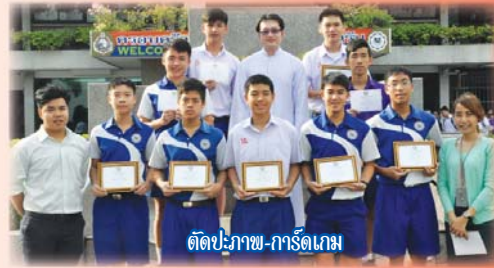
ตัดปะภาพ-การ์ดเกม