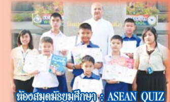
ห้องสมุดมัธยมศึกษา : ASEAN QUIZ