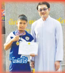
โรมัสโซ่