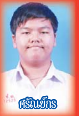
ศรีณย์กร