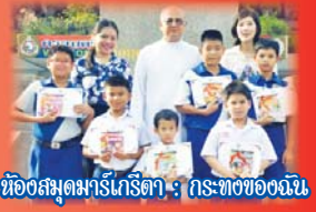
ห้องสมุดมาร์เกริตา : กระดาษของฉฉฉฉ