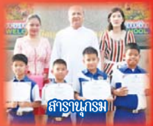
สารานุกรม