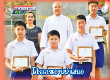
โปรแกรมนำเสนอ