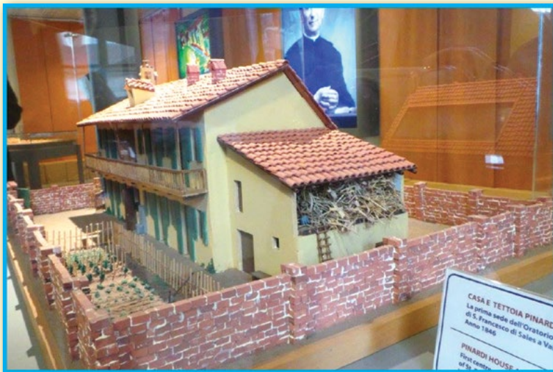
แบบจำลองบ้านปินาร์ดี

เดือน เมษายน พ.ศ. 2389 (ค.ศ. 1846) คุณพ่อบอสโกตกลงใจเช่าเพิงหลังคาขนาดกว้าง 6 เมตร ยาว 15 เมตร สูงจากพื้นประมาณหนึ่งเมตรซึ่งใช้เป็นที่เก็บของ เพิงแห่งนี้ต่อจากตัวบ้านชั้นเดียวยกพื้นหลังย่อม ที่บันไดไม้และเฉลียงปรากฏรอยเหมือนมอดกัดกิน เจ้าของบ้านมีนามว่า นายฟรานเชสโก ปินาร์ดี (Francesco Pinardi) หลังจากที่ได้สนทนากันเกี่ยวกับการดัดแปลงสถานที่และราคาเช่า สถานที่แห่งนี้คือ ศูนย์เยาวชนซาเลเซียนถาวรแห่งแรก ที่ถือกำเนิดขึ้นมาด้วยความเรียบง่าย แม้อย่างจน คับแคบ ทว่าเปี่ยมล้นด้วยความรักและผูกพัน คุณพ่อบอสโกขนานนามที่พักซึ่งท่านได้เห็นว่า “ภาวนาคาร” (Oratorio) เพราะท่านมุ่งหมายให้ชื่อนี้เป็นที่เตือนใจเด็กและเยาวชนอยู่เสมอว่า การสวดภาวนาเป็นแก่นสารแห่งชีวิต อาศัยการอธิษฐานภาวนาเป็นหลักสำคัญที่ช่วยให้ภารกิจหน้าที่การงานทั้งหลายทั้งปวงบรรลุผลสำเร็จ กิจกรรมในศูนย์เยาวชนดำเนินไปอย่างราบรื่น จำนวนเด็กและเยาวชนที่มาร่วมกิจกรรมมีมากขึ้นทุกสัปดาห์ คุณพ่อบอสโกจึงจำต้องเช่าห้องเพิ่มขึ้น ท่านได้ทำหน้าที่ศาสนบริกรตามวัดและสถานที่ที่หลายแห่ง เงินที่ได้รับมาจากการปฏิบัติศาสนพิธีก็นำมาจ่ายซื้ออาหารการกินสำหรับเด็กและเยาวชน ตลอดจนสิ่งของที่จำเป็นสำหรับกิจการของท่านในแต่ละสัปดาห์ กระทั่งไม่นานนักท่านต้องล้มป่วยหนักที่สุดจนเกือบเอาชีวิตไม่รอด