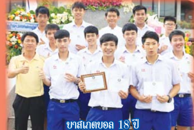
บาสเกตบอล 18 ปี