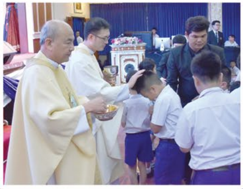
ตอนรับครูใหม่และนักเรียนใหม่ ประจำปีการศึกษา 2560