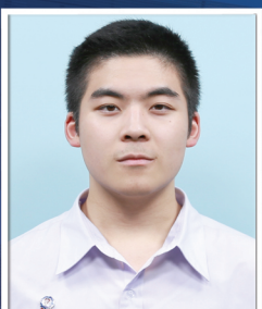
ชานล สิงหะ

คณะบริหารธุรกิจ สถานีวิจัยการประกอบการแห่งอยุธยา