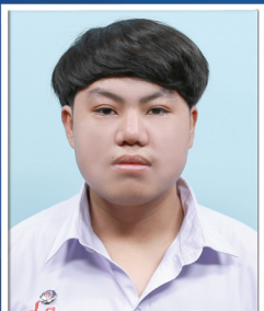
บดี ป้ายปาน