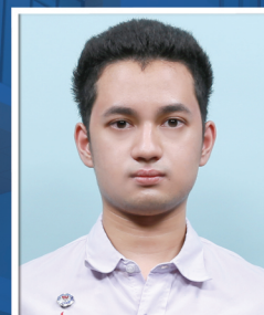
อินดา ลากนทีwijิตร