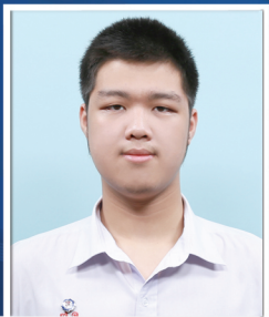
กัทขกร กำปนานนท์

สาขาบริหารธุรกิจ (หลักสูตรนานาชาติ) วิทยาลัยดุสิตธานี