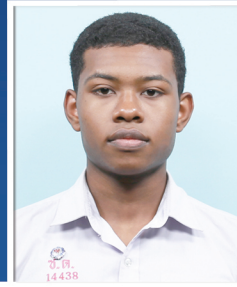
วช ออลาบอดี เอดาเลอ

วิทยาลัยวิทยาศาสตร์และเทคโนโลยีการกีฬา มหาวิทยาลัยมหิดล