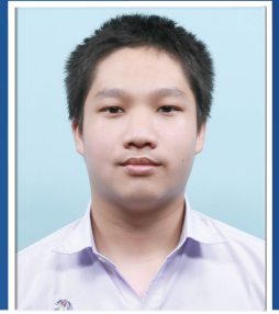
กuanminth ก้อนทอง

คณะวิทยาศาสตร์ มหาวิทยาลัยศรีนครินทรวิโรฒ