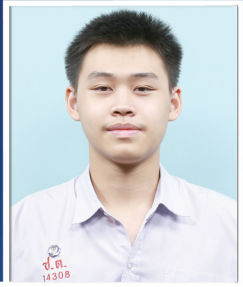
ปรวิวัฒน์ หรือเมืองเดิม