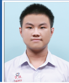
กวดล สมบูรณ์แสงอรุณ

คณะวิศวกรรมศาสตร์ มหาวิทยาลัยเกษตรศาสตร์