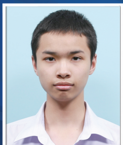
กาวัด ชินศิริมงคล

คณะวิทยาศาสตร์ มหาวิทยาลัยศรีนครินทรวิโรฒ