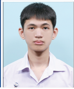
ฤกษ์เอก ตาลาน