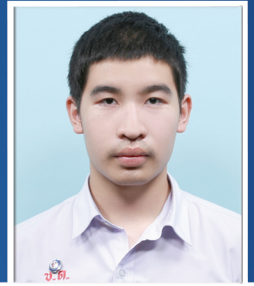
ธรรมธร องค์กรศิริพร

คณะบริหารธุรกิจและเศรษฐศาสตร์ มหาวิทยาลัยอัสสัมชัญ