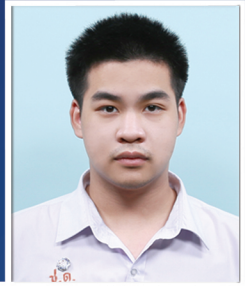
คนาริป ห้วยหย่งทอง

คณะวิทยาศาสตร์ มหาวิทยาลัยธรรมศาสตร์ (สถาบันเทคโนโลยีนานาชาติสิรินธร)