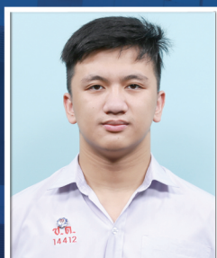
อาาเพนคีย์ แอวูเช็ง