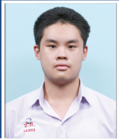
อารยธรรม ธารากุลประทีป

คณะวิศวกรรมศาสตร์ มหาวิทยาลัยเกษตรศาสตร์